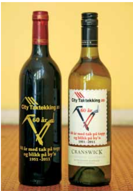
Smakfulle jubileumsgaver med egne etiketter

– Arbeidstilsynet er på de seriøse bedriftenes side. De hjelper oss med å få bort