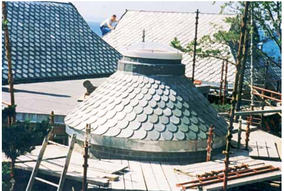
Skifertekking av hytte på Larkollen. Under det spesielle taket med lysåpning i midten er det et stort boblebad.

useriøse konkurrenter; bedrifter som priser jobber lavt fordi de ikke priser inn stillas og andre HMS-tiltak.